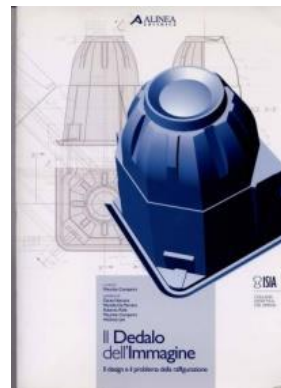
A. LEE & C