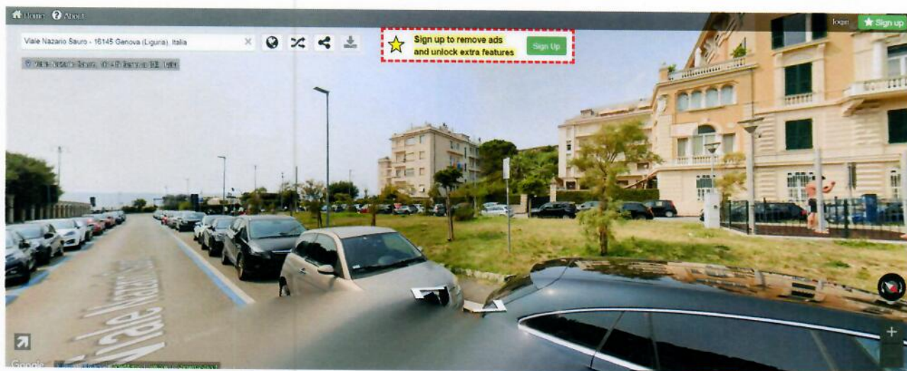
Viale Nazario Sauro