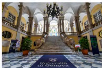
Informazioni utili per iscriversi