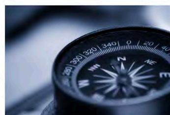
Eventi e strumenti di orientamento