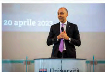
Il Rettore incontra le scuole