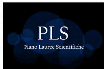
PLS Piano Lauree Scientifiche