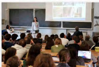
Seminari nelle scuole