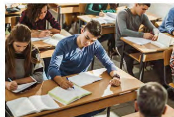
UniGe entra nelle scuole