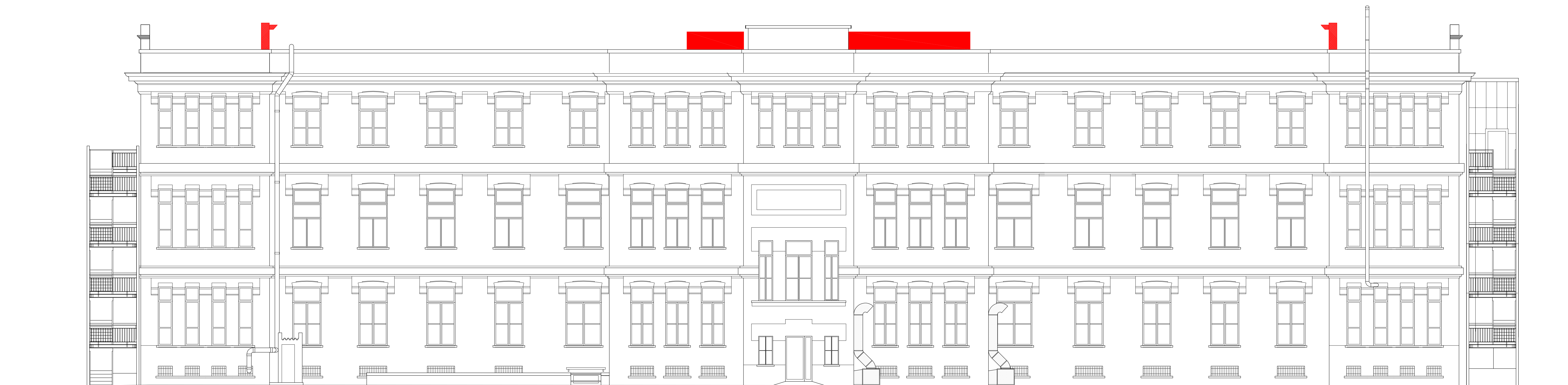
PROSPETTO NORD-EST - RAFFRONTO