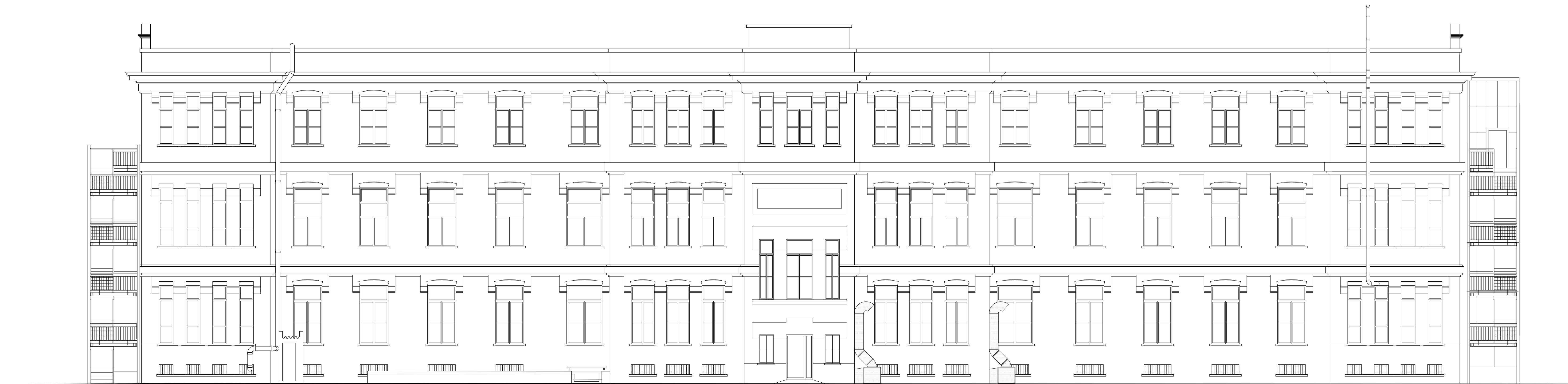
PROSPETTO NORD-EST - STATO ATTUALE