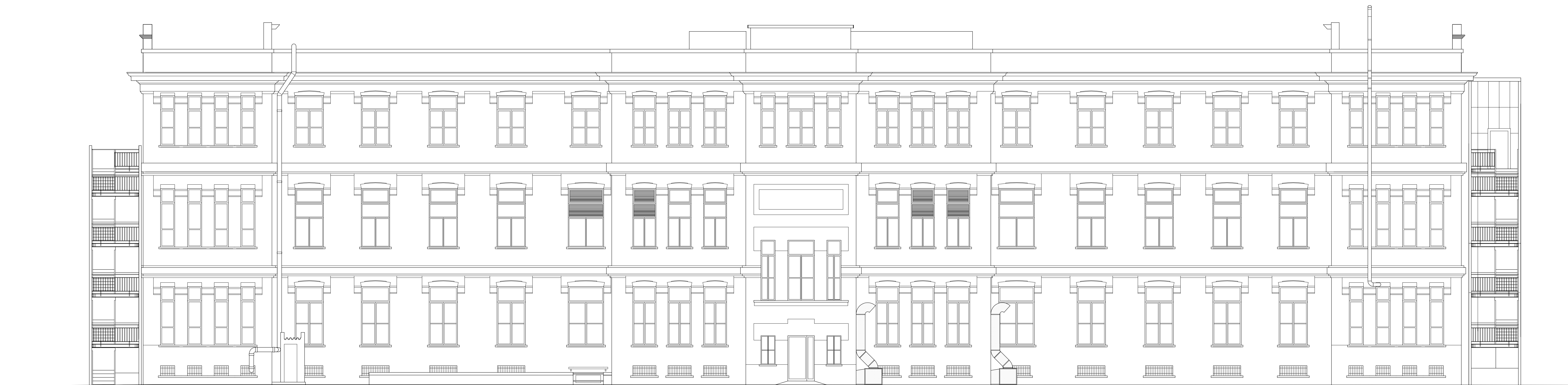
PROSPETTO NORD-EST - PROGETTO