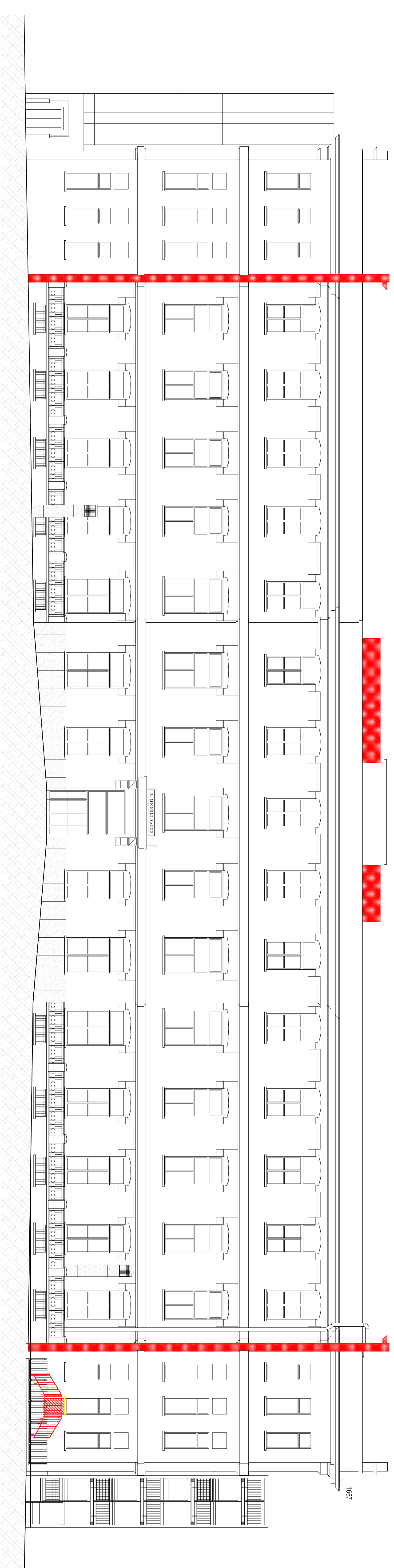
PROSPETTO SUD-OVEST - RAFFRONTO